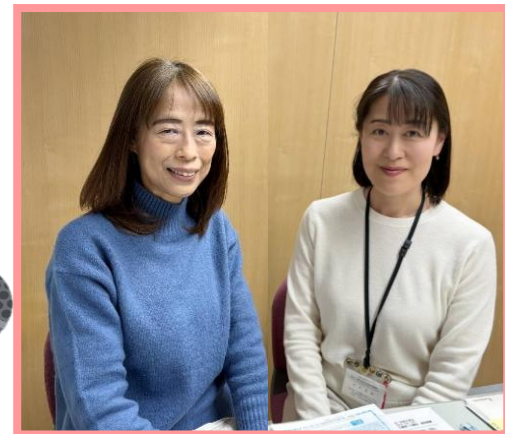
つるがしまふれあいサービス コーディネーター